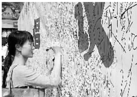
无车日,市民在倡议书上签字。