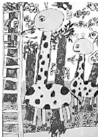
长颈鹿 校园记者 刘世瑜 辅导老师 孙宁