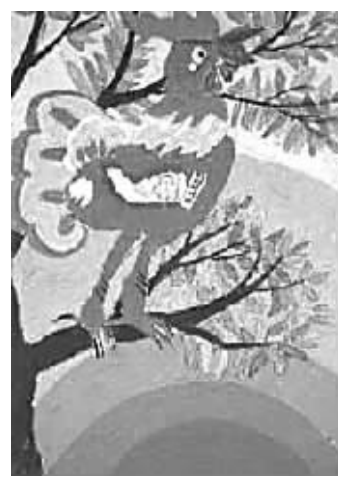
晨 校园记者 龚子丰 辅导老师 孙宁