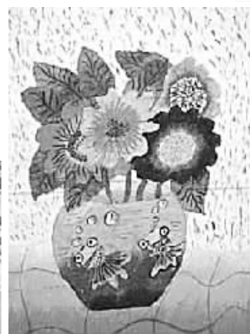
金鱼与花 校园记者 郭好雨 辅导老师 张琦