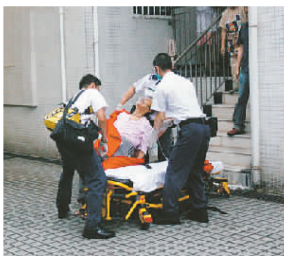
▲沈殿霞在家昏迷被送去急救