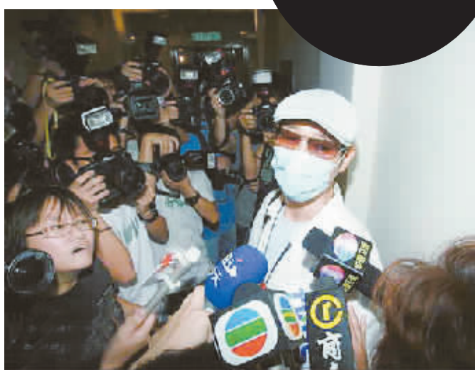
▲郑少秋在医院遭记者围堵

据香港媒体报道,昨日上午10时,香港艺人沈殿霞于家中突然昏迷,由救护车送医院抢救,一度要用仪器协助呼吸,其女儿郑欣宜陪同到急症室。 沈殿霞在伊利莎白医院急症室急救两个多小时后,下午1时18分由救护车转送玛丽医院,目前仍在玛丽医院深切治疗部留医。沈殿霞的前夫郑少秋昨日傍晚到医