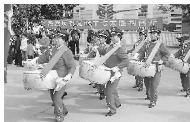
昨日,南阳新村办事处新村社区的文艺爱好者们,自发组织在新村社区文化广场,身披彩衣、敲锣打鼓,开展了喜庆十七大文艺表演活动。

“提高农民素质,是新农村建设的重要内容,不能让他们像以前一样光着背在村口打牌。得让他们学知识,提高文化素质。”办事处驻村干部说。在官庄,新落成的大院粉刷一新,村干部正筹备购买图书。干部们用“十二有”的顺口溜来表现软件与硬件的结合:有规可依,有章可循;有业可就,有钱可花;有房可住,有路可行;有学可上,有病可医;有水可吃,有澡可洗;有事可议,有戏可听。