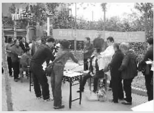
昨日,紫荆山南路街道办事处陇海南里社区开展爱心服务活动,有特长的居民放下手头的工作,免费为居民按摩、修电器、清洗灶具,现场充满浓浓的真情。