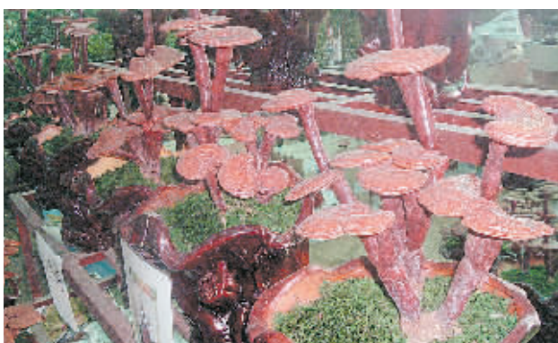
“瞧,这就是灵芝草,制成盆景还真漂亮!”昨日上午,记者在一家花木城看到了灵芝草制成的盆景。据介绍,这种盆景是在北方灵芝的基础上培育成功的,尽管价格不菲,但很受市民喜爱。