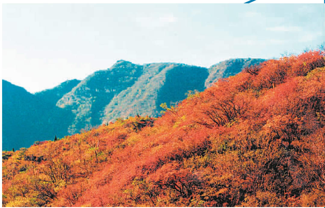
嵩山红叶节已经开始,少林景区管理局在每周六、周日开通郑州至少林景区赏红叶直通车,吸引了不少绿城市民登山观红叶。据悉,嵩山独特的地理环境和气候特征形成了以高山黄栌为主的大片红叶林带,红叶区面积达20多平方公里,是中原地区红叶的最佳观赏地。

困难标准由各地根据当地经济发展状况和法律援助工作的需要,可适当高于当地最低生活保障标准执行。 同时,公民申请法律援助符合下列条件之一的,不再审查其经济困难状况:持有民政部门发放的“城市居民最低生活保障证”、“农村居民最低生活保障证”(或“农村特困户救助证”)、“五保供养证”的;可证明是在养老院、孤儿院等社会福利机构由政府供养的;农民工请求支付劳动报酬、工伤赔偿和人身损害赔偿的;主张因见义勇为行为产生的民事权益的。