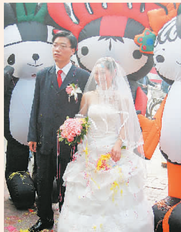
昨日上午,一场时尚婚礼在嵩山路一家酒店举行,酒店门口五个巨型奥运福娃的出现吸引了不少市民观看。在众人好奇的目光中,新郎新娘没有坐名车,而是步行走向婚礼酒店。两位新人以这种独特的方式迎接奥运,既节俭又环保。

这部20集的电视连续剧由八一电影制片厂、中国电视家协会、河南炎黄文化研究会联合摄制,计划在解放郑州59周年纪念日前后开机,预计拍摄时间为一年,争取在明年郑州解放60周年纪念日前与广大电视观众见面。