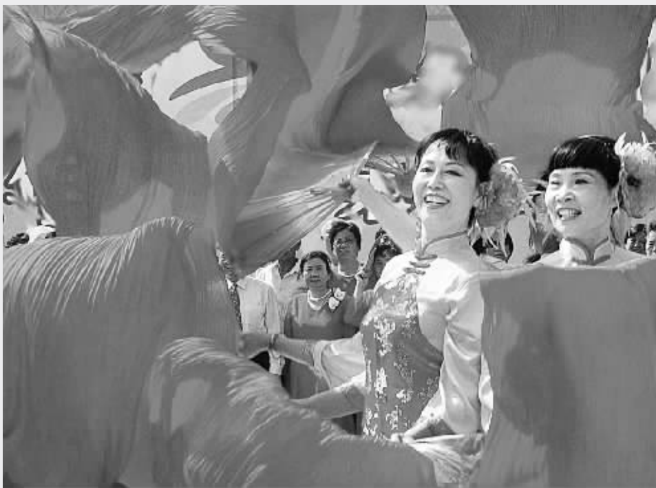
党的十七大胜利闭幕的消息传来,我市大街小巷处处涌动着喜庆的热潮,人们在市区广场、游园敲起欢乐的锣鼓,跳起欢快的舞蹈。干部群众纷纷表示:十七大报告为今后的科学发展指明了道路。