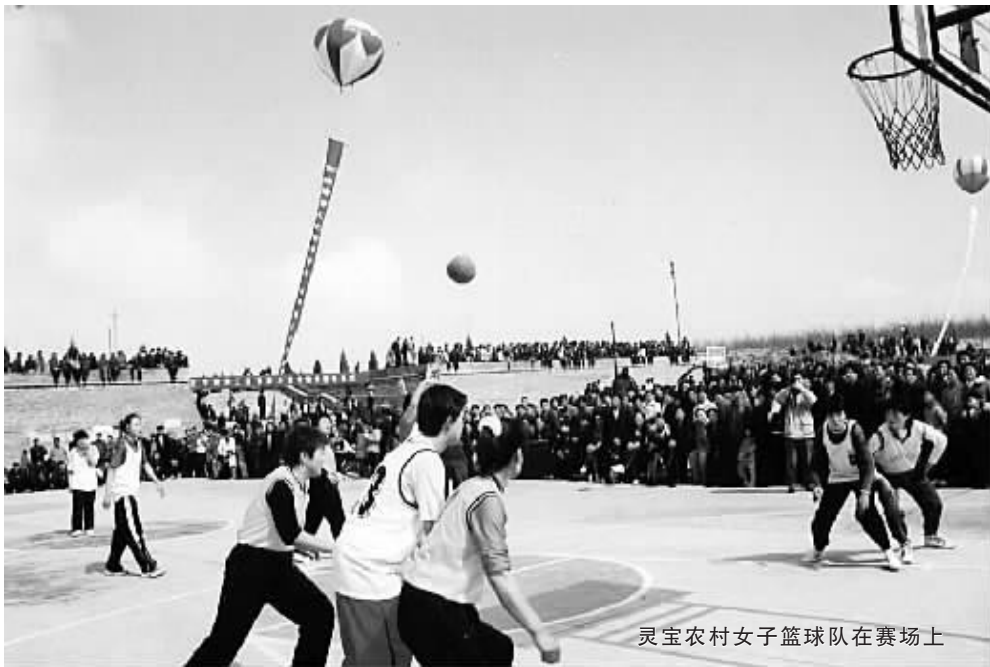
灵宝农村女子篮球队在赛场上