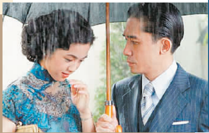
▲汤唯、梁朝伟演绎一场爱情悲剧