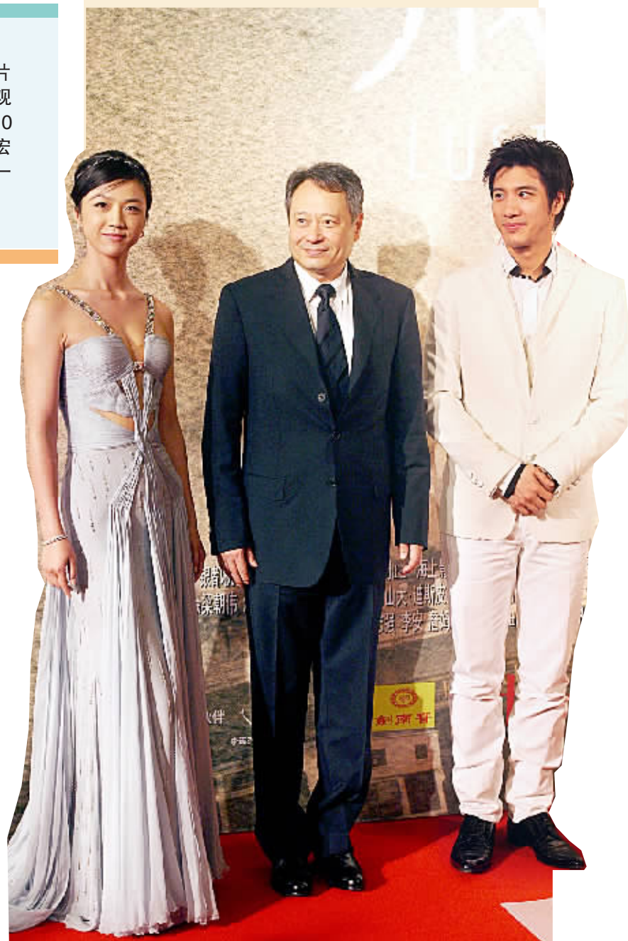
▲昨晚,导演李安(中)和演员汤唯(左)、王力宏在上海《色·戒》首映礼上。

11月1日零点,李安的新片《色·戒》终于揭开重重面纱与内地观众见面。在全国同步上映之前的10月31日晚,李安携主演汤唯、王力宏现身上海影城,为该片在内地的唯一一场首映助阵。