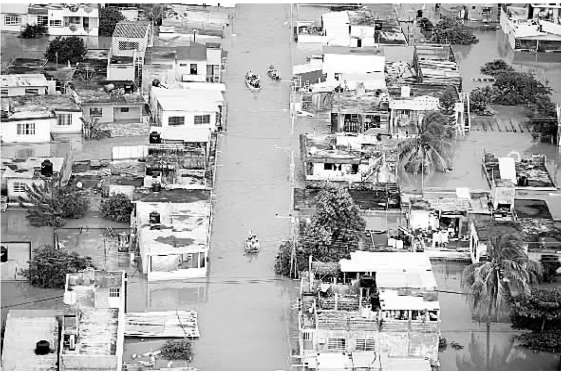
墨西哥塔瓦斯科州首府比亚埃尔莫萨遭受洪灾的情形。

热带风暴“诺埃尔”在席卷了多米尼加共和国和加勒比海后,1日又开始侵袭古巴和巴哈马。截至目前,“诺埃尔”已导致加勒比海沿岸国家超过110人丧生。