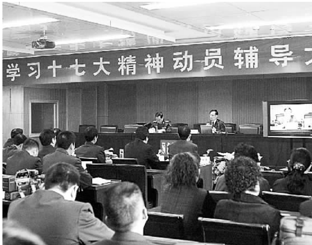
1日上午,某预备役高炮师邀请河南省社科院副院长喻新安,就十七大报告为官兵进行讲解。