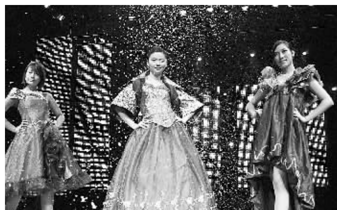
昨晚,新落成的河南艺术中心小剧场首度开门迎客,河南省群众艺术馆和郑州市群众艺术馆在这里成功举办了《河风海韵》文艺晚会。首场试演的成功标志着河南艺术中心继音乐厅、大剧院之后又一个单体基本落成。