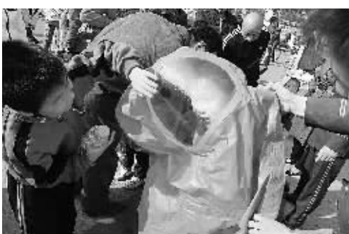
在“119”到来之际,文化路街道办事处联合金水区消防大队,在郑州市动物园举办了一场消防展览,用途各异的消防器具,吸引了众多市民的眼球。

本报讯(记者 谢庆 通讯员 王文峰)记者昨日从郑州市住房公积金管理中心上街分中心了解到,前三季度,上街区已归集住房公积金1.05亿元。 上街区自1995年开始建立并推行住房公积金制度以来,截至2007年9月底,该区410多个单位的34000多名职工建立了住房公积金制度,住房公积金覆盖面及缴存率均达90%以上。已累计归集住房公积金8.4亿元,住房公积金归集金额达6.25亿元,连续多年名列全省(市)区第一。 目前该中心已发放住房公积金个人贷款1400多笔,金额1.6亿元,支持个人购房面积15.7万平方米,为解决中低收入职工住房困难发挥了重要作用。