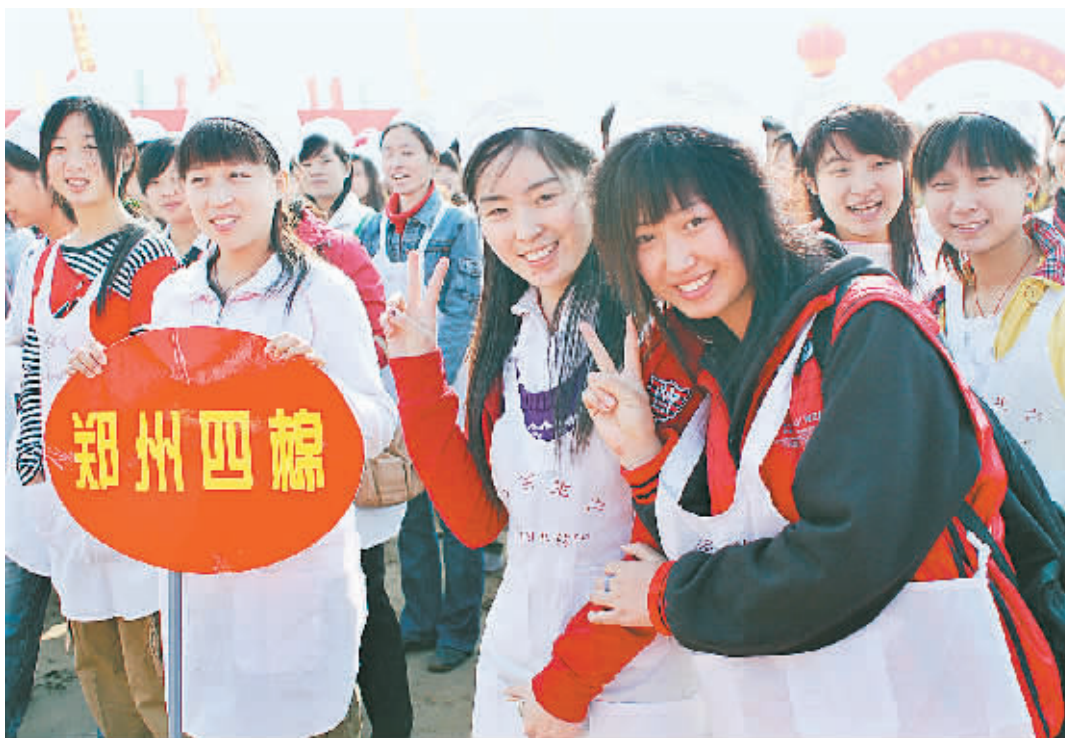
新一代纺织女工在项目奠基仪式上。

本报讯(记者 孟斌 陈锋)昨日，郑汴产业带第一个大型工业项目——郑州四棉纺织有限公司迁建工程在中牟白沙工业园区隆重奠基，郑汴产业带建设工程正式启动。市领导胡荃、武国瑞等出席奠基仪式。