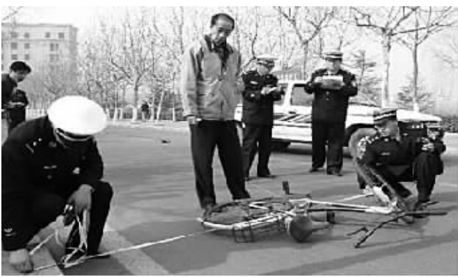
日前,威海市交巡警支队举办“交通事故处理大比武”活动。