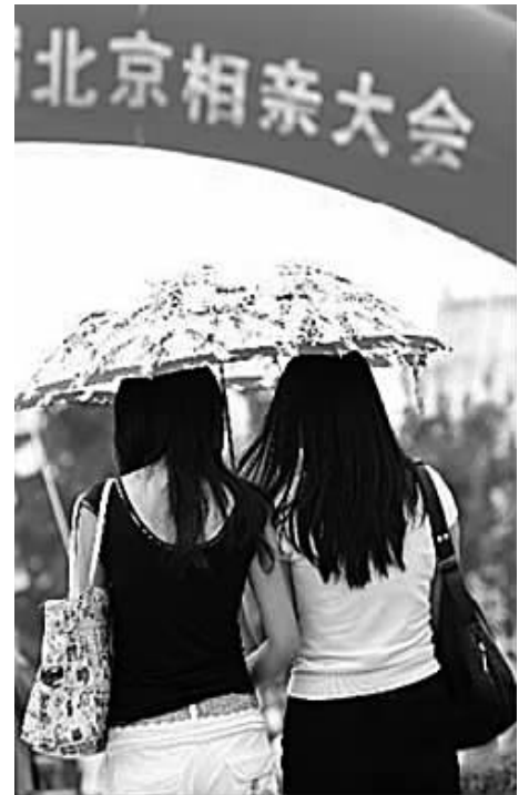
农历七夕之际,“北京相亲大会”在北京国际雕塑公园举办。活动现场特别设置了父母操心专场、成熟魅力专场、硕博专场、70专场、80专场、海归专场等分区。

对此,浙江大学社会学系的王小章教授认为,大学可以称之为恋爱的黄金时间。在校大学生时间比较充裕,有比较多的时间来交往、接触。而一旦踏上了工作岗位,工作压力增大,虽然可接触的人群可能增多,但是大多数人的交往却变成了“浅交往”,这也就是为什么很多人在结婚问题上都成了“老大难”。