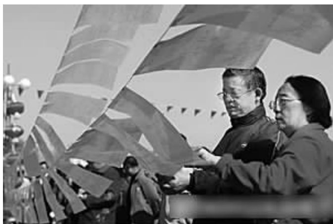
日前,太原市首届相亲大会在太原龙潭公园举行,两位老人在看相亲资料,为子女物色对象。

“我认为,在校大学生提前为自己规划人生也是正常的,我们还是应该对大学生相亲这种现象持宽容的态度,但同时也需要有一个良好的引导,促使其往正面发展。”王教授最后说。 据新华社