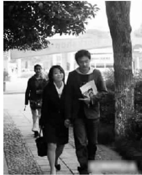
在大学时就找个伴侣成为很多大学生的想法。图为一对情侣走在杭州某大学校园的林荫道上。

那个男孩发短信说对她的印象很好,她看到后很开心。从那天起他们就在手机和QQ上聊天,随着时间的推移,双方的好感度也与日俱增了。第三次去男方家玩的时候,男方的妈妈送了小林一条象牙的项链。据说,是他妈妈保存了十年的东西,就为了给未来儿媳的。那个男孩是2007年浙江理工大学毕业的,现在嘉兴工作。小林回到学校后,两个人就每天晚上在QQ上视频聊天,小林觉得现在非常幸福。