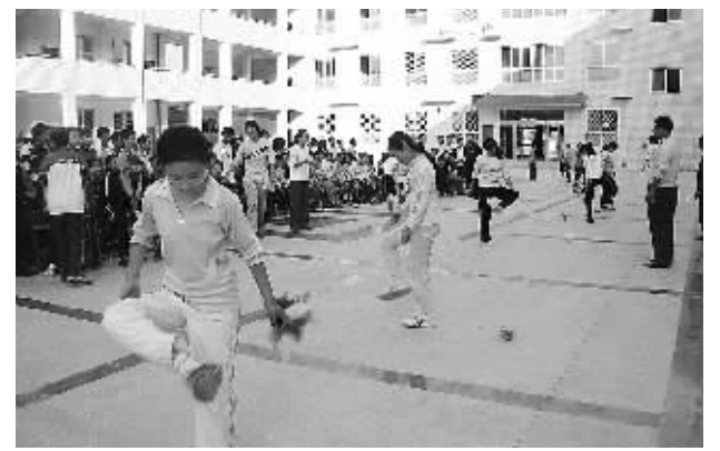
为了丰富学生的课外生活,金水区第七十五中学利用下午大课间的时间举行了打乒乓球、踢毽子等有益于学生身心健康的体育活动,培养学生的集体荣誉感。

由于长期受体制、机制等因素制约,金水区像全国大部分地区一样,城乡卫生事业发展很不平衡,区人民医院技术、