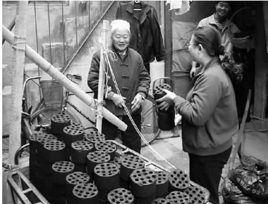
昨日上午,金水区杜岭街道党工委组织工作人员到辖区40余户老党员及贫困户家中进行节前慰问,为他们送去了取暖煤球3万余块,给老党员和贫困户送去温暖。

“我们全大队126名民警,每位民警每天做一件好事,一天就是126件,一个月就是3600多件,一年就是40000多件,一直开展下去,我们的辖区一定会出现一个全新的气象。”特巡警二大队大队长王勇说。