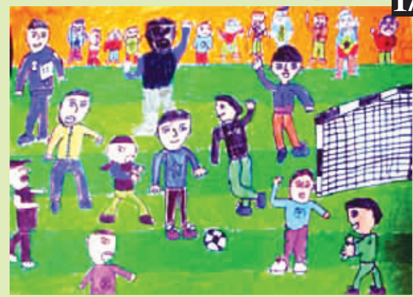
足球场上 龚子丰 辅导教师 孙宁