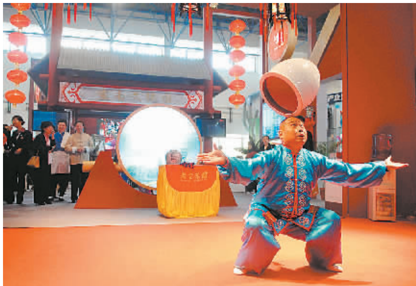
11月8日,一名艺人在北京宣武区展区展示顶缸绝技。当日,第二届中国(北京)国际文化创意产业博览会展览会在京开幕,本届展览会吸引了15个国家和地区的1300多家企业参展,汇集广播电视、博物馆、城市雕塑、体育产业、

每年一次的美国乡村音乐协会奖由美国乡村音乐协会颁发,共设12个奖项,以表彰当年在乡村音乐歌坛取得突出成绩的歌手和制作人员。获奖者由该协会6000多名会员投票选出。