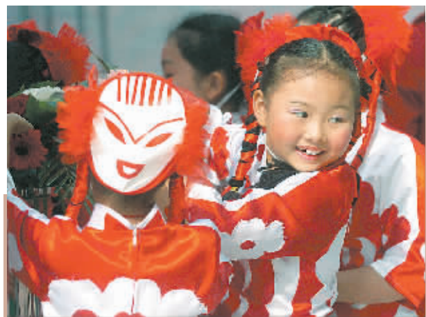
11月8日,穿着剪纸造型服饰的孩子们前来表演助兴。当日,国风归来——中国第二届剪纸艺术展在武汉开幕。

当音乐响起,疲乏的舟舟仿佛换了一个人,指挥棒在他的手里划出一道道优美弧线,他浑身的音乐细胞都活泛了起来,脸上也流露出难得的微笑,乐团在他的指挥下奏出了《北京喜讯到边塞》《博吉上校进行曲》《卡门序曲》《瑶族舞曲》等乐曲,不过,因为嗓子不舒服,舟舟演出中不停地扯自己的领结。最终,1个小时40分钟的演出在《拉德斯基进行曲》中结束。