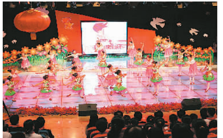
7日晚,出席市少代会的全体代表在市教育电视台演播厅举办了“放飞梦想,快乐成长”主题晚会,少先队员们用舞蹈、合唱、快板等节目展现了少先队员们快乐生活。

阿圭列斯计划在透明玻璃屋中生活到本月13日,除了在卧室外,阿圭列斯的谱曲、演奏以及所有生活起居将被人们一览无余,她将通过4台电脑终端与外界联系。新华社·路透