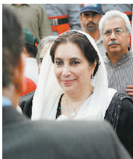
↑12日,在巴基斯坦的拉合尔,贝·布托来到巴民族诗人阿拉马·穆罕默德·伊克巴尔的墓地拜谒。