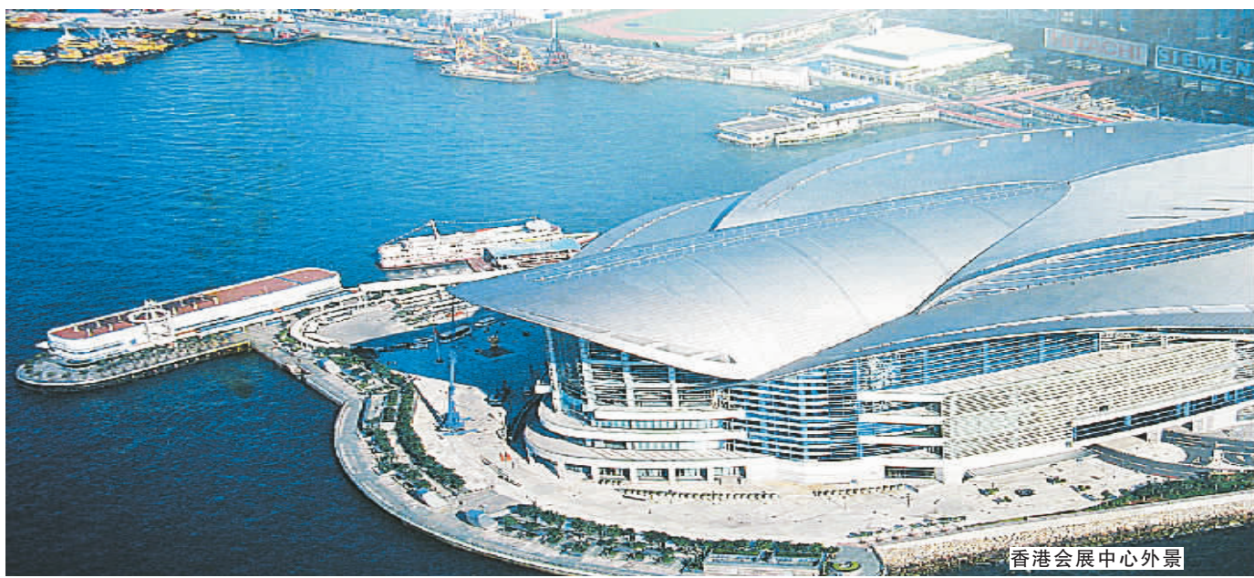
香港会展中心外景

生于美国,在大型公众集会设施的管理及行政方面拥有40多年的经验。曾任香港理工大学酒店及旅游管理学院咨询委员会主席,是香港会议展览中心(管理)有限公司的董事总经理,并兼任多个国际专业协会会员。此前曾任国际展览联盟的董事局成员及行政副总裁,近期在法国召开的国际展览联盟大会上荣任总裁。2006年5月起,以他为董事长的郑州香港会展管理有限公司接管郑州国际会展中心。