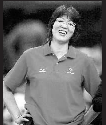
11月15日, 美国队主教练郎平在比赛后笑容满面。当日, 在日本名古屋举行的 2007 年女排世界杯比赛中, 美国队以 3:0 战胜日本队。

心有多大, 舞台就有多大。随着阿联不断进步, 他的“心”肯定会越来越大, 当他从“菜鸟”变成“明星”, 阿联在 NBA 的“舞台”也一定会越来越大。 陈凯