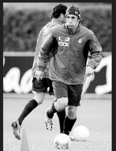
11月14日, 意大利队球员托尼(前)在训练中。当天, 意大利国家男足在佛罗伦萨进行集训, 备战将于本月 17 日在格拉斯哥进行的 2008 年欧洲杯 B 组预选赛客场挑战苏格兰队的比赛。