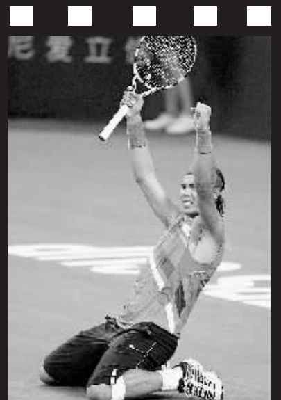
11月15日, 在上海进行的 2007 网球大师杯比赛中, 西班牙选手纳达尔以 2:0 战胜塞尔维亚选手德约科维奇。

然而此后的火箭又重蹈上一场败给灰熊的覆辙: 找不着篮筐, 10 次投篮一分未得! 只是靠姚明 8 次罚球和最后一秒上篮得到 7 分。实际上在这最后 5 分钟里火箭仅在罚球这一环节上处理好, 比赛可能就是另一番结果。姚明连续 4 场创下 34 罚 34 中的纪录, 可关键时刻他 8 罚投失 3 球, 下半场表现神勇的韦尔斯两罚全中。里外火箭白丢 5 分, 而此役火箭仅输了 3 分。此役姚明 18 投 6 中得 26 分, 抢到 13 个篮板球。