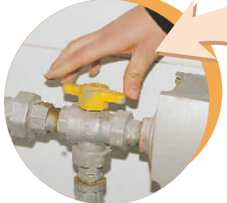
在居民家中,每个房间的暖气片上都安装有一黄色开关。如果居民不住这个房间,可关闭该阀门,用户还可根据需要调节房间的室内温度。