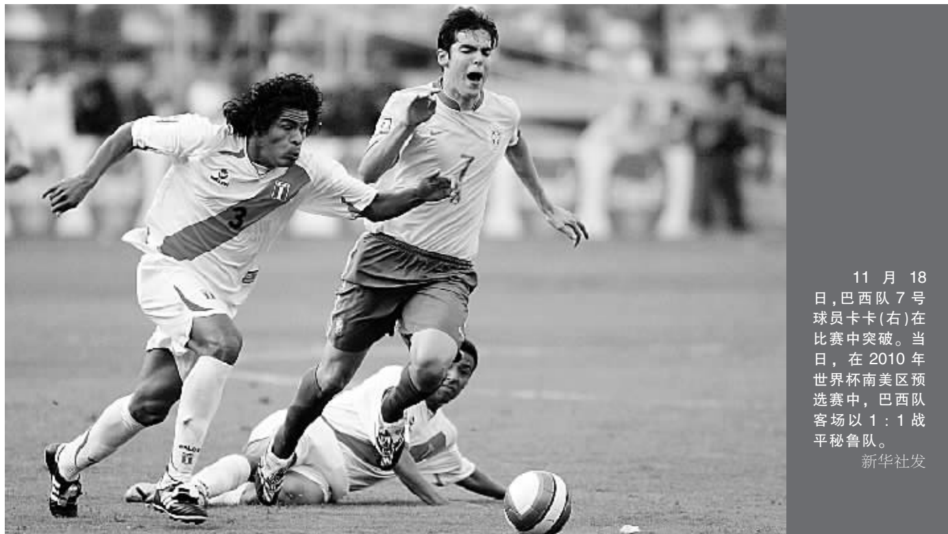
11月18日,巴西队7号球员卡卡(右)在比赛中突破。当日,在2010年世界杯南美区预选赛中,巴西队客场以1:1战平秘鲁队。

由4名选手组成的中国队此次夺得两金两银,每个人都获得了奖牌,表现不错。陈寅和焦刘扬分别获得男子200米蝶泳和女子200米蝶泳的金牌。