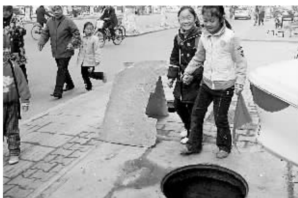
昨日,在伏牛路与颍河路交叉口南侧伏牛路二小等几所中小学附近,两个窨井大张口,给过往行人,尤其是中小学生在留下了安全隐患。