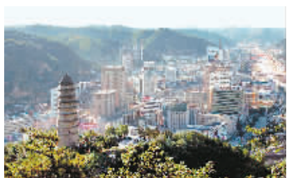
日前,国家统计局公布了2006年全国综合实力百强城市名单,陕西省延安市首次进入了全国百强城市行列。

承办方漯河市政府有关负责人昨日透露,大赛期间,平均每天有超过300名选手统一服装,在总面积近40000平方米的漯河市科教文化艺术中心广场同台竞技。届时,市民可以免费参观,所有观众都能近距离一睹豫菜名厨风采。