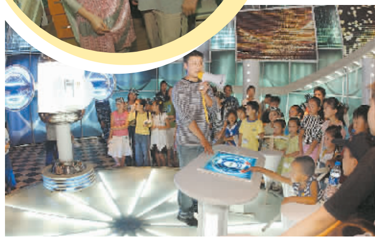
青少年影迷走进摄影棚参观游览。