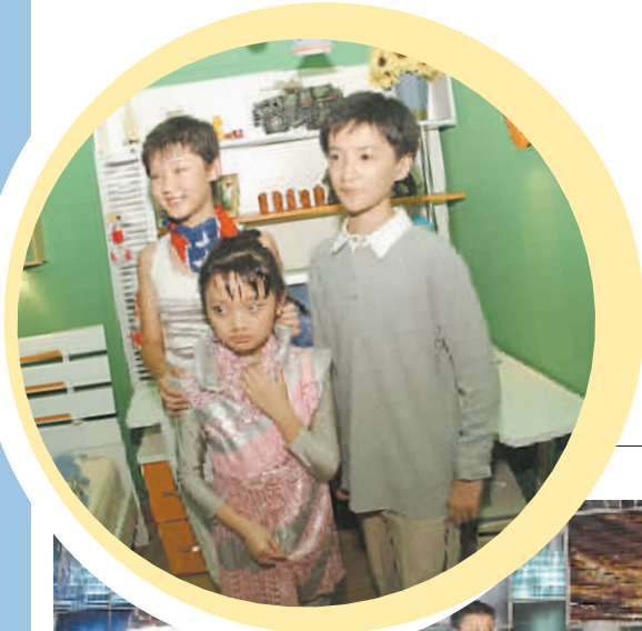
《快乐星球》的小演员在摄影棚内。