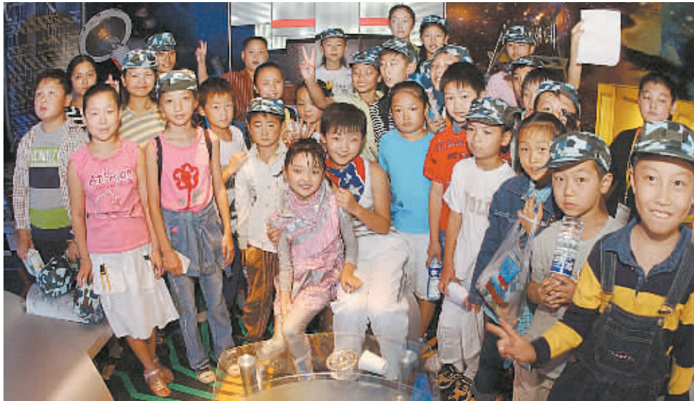
《快乐星球》获得成功后,每周都会有许多青少年影迷来到拍摄基地。图为孩子们同自己喜欢的小明星合影留念。

《廉租住房保障办法》将于12月1日起正式实施,2004年起实施至今的《城镇最低收入家庭廉租住房管理办法》同时废止。