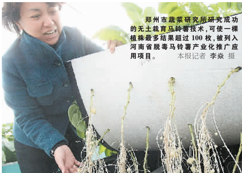
郑州市蔬菜研究所研究成功的无土栽培马铃薯技术,可使一棵植株最多结果超过100枚,被列入河南省脱毒马铃薯产业化推广应用项目。

据了解,用矿渣料制成的免烧砖很受建筑商的青睐。开发3个月来,累计制砖1600万块,仍不能满足市场需求。按照现在的速度,灰渣坝可供三个村共同开发5-8年。