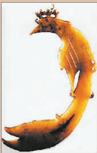
商代的玉凤。这件装饰品 1976 年在河南省安阳殷墟妇好墓出土,现藏中国历史博物馆。这是迄今为止发现的最早的玉凤造型。