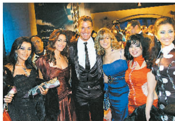
11月27日晚,多个国家的演员在埃及首都开罗的开罗歌剧院合影。当晚,为期11天的第31届开罗国际电影节正式开幕。

新华社开罗 11 月 27 日专电(记者余忠稳 郭春菊 陈寂)第 31 届开罗国际电影节 27 日晚在开罗歌剧院隆重开幕,开幕影片是英国片《葬礼上的死亡》。去年电影节最佳女主角奖得主、中国女演员张静初应邀出任评委。