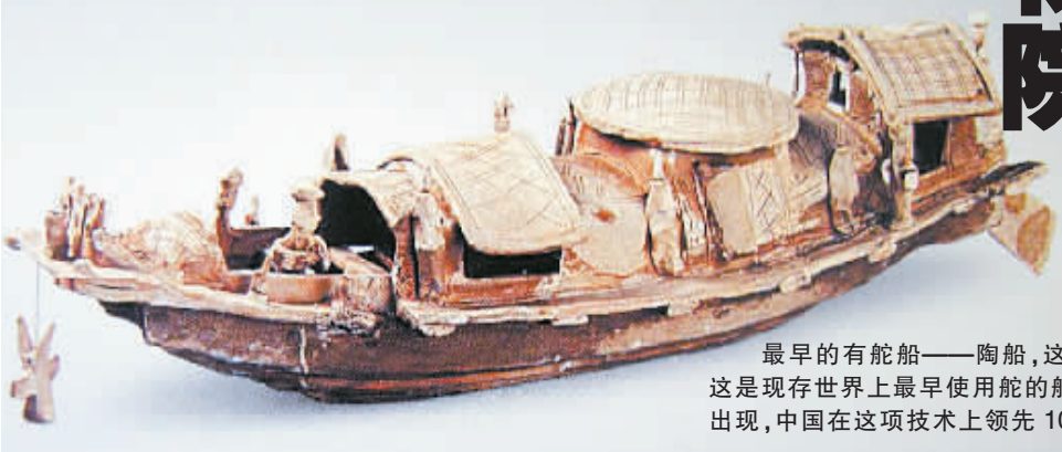
最早的有舵船——陶船,这具陶船模型出土于广东,是东汉时期的作品,这是现存世界上最早使用舵的船的模型。在西方造船史上,舵直到 1242 年才出现,中国在这项技术上领先 1000 多年。