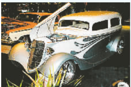
改装老爷车:1933 年的福特汽车