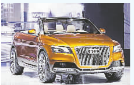
奥迪敞篷式轿车 Cross Cabriolet Quattr

洛杉矶车展上一辆号称“全球最快”的小型车吸引了人们的注意。这款车给人最深的印象是只有普通车的一半宽。这辆手工制作的汽车设计宽度 0.99 米,这意味着它几乎可以钻进北京最窄的胡同,在公路上只需占用半条车道。一位车迷打趣说,只要房门够宽,可以把它开进客厅里。但别小看这辆车,据设计者介绍,它采用的赛车发动机,可以在 4 秒钟加速到 60 英里,令人咋舌。据悉,这款车是一对父子经过 9 年努力设计完成的,目前投入销售的有两辆车。