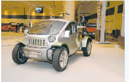
Jeep TREO 概念车