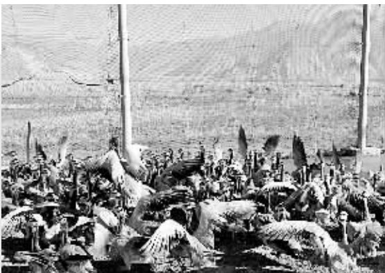
西藏山南地区贡嘎县人工养殖的第三代斑头雁群(12月2日摄)。目前,贡嘎县已有人工养殖斑头雁300多只。经过多年努力,西藏自治区有关部门大规模人工养殖斑头雁成功。

对于企图歪曲历史的日本右翼来说,最具说服力的无疑是来自当年日本参战官兵的亲笔记录。此前,日本右翼辩称,当年日本官方对南京大屠杀不知情。而这些来自于日方的史料表明,他们(日本官方)当时从许多渠道都得知了真相。