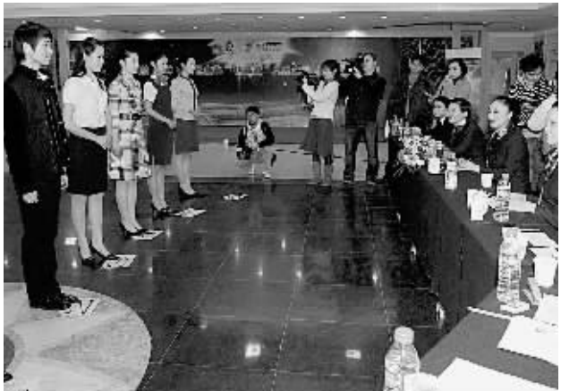
12月4日,参加国航在成都“奥运空乘新星”招募的选手参加面试。国航招募的“奥运空乘新星”将主要为2008年北京奥运会运输提供服务。西部九省区市的600余名选手在成都应试。