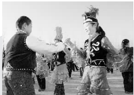
4日,几名小学生正在练习哈萨克舞蹈健身操。甘肃省酒泉市阿克塞哈萨克族自治县小学将哈萨克族民间传统舞蹈改编成适合青少年的健身操,并且引入日常教学中,深受学生的欢迎。