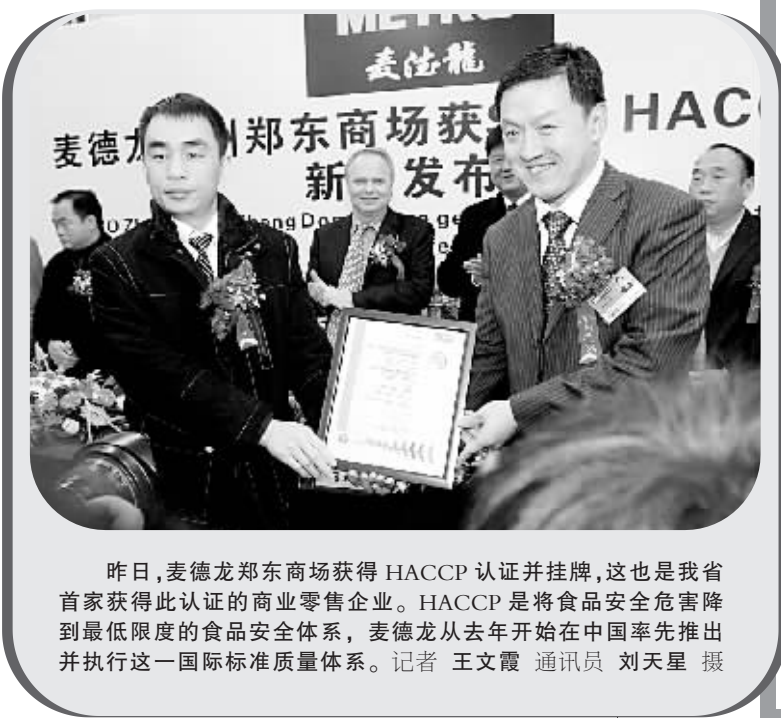
昨日,麦德龙郑东商场获得 HACCP 认证并挂牌,这也是我省首家获得此认证的商业零售企业。HACCP 是将食品安全危害降到最低限度的食品安全体系,麦德龙从去年开始在中国率先推出并执行这一国际标准质量体系。

年3月份;播音与主持艺术类从1月27日开始分批进行。书法类考试时间为2008年1月26日;服装模特类和艺术模特类从1月17日开始分批进行;空乘类从1月17日开始分批进行;影视表演类从1月27日开始分批进行;编导制作类从1月16日开始分批进行。