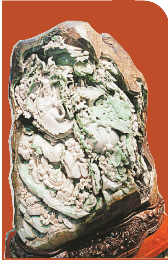
翡翠雕件起拍价 380 万

郑州粮食批发市场副总经理肖永成接受采访时说:“国家持续加大临时存储小麦市场投放力度,不仅满足了当前面粉加工企业实际需求,而且有效地控制了价格大幅上涨。”