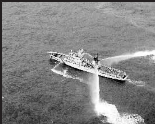
7日,一艘在香港注册的油轮在韩国忠清南道泰安郡西北约6海里的海域与一艘韩国船舶相撞,目前已造成1050万升原油泄漏,周围至少15平方公里的海域受到污染。