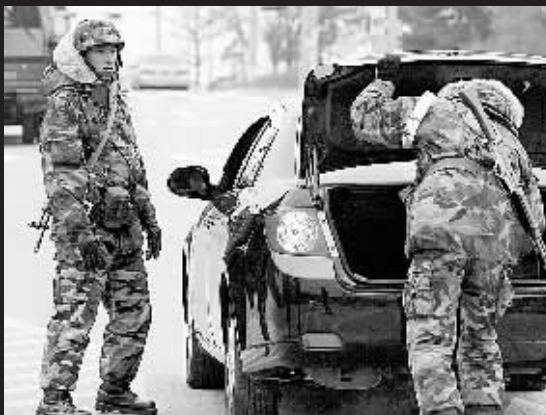
7日,韩国军警在首尔以南约60公里处检查过往车辆。韩国仁川市江华岛6日晚发生一起针对士兵的袭击事件,一名袭击者驾车撞倒两名执勤士兵,抢走步枪、手榴弹潜逃,遇袭士兵一死一伤。