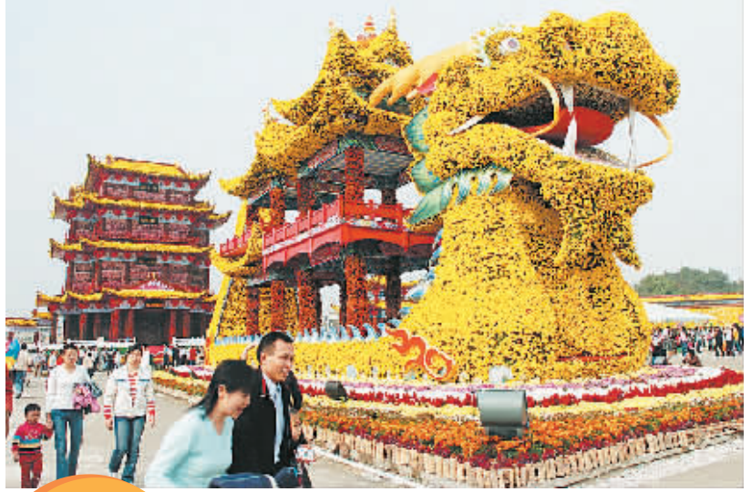
小镇菊展 12月9日，在... 菊花展吸引了众多市民前来观赏。

据一项最新调查，在沪深两市炒股的上班族中，有70%的人没有赚到钱，而有一半的人将一半的工资投入股市。调查还显示，许多上班族在股市中投入的资金，甚至超过了他们的月工资。