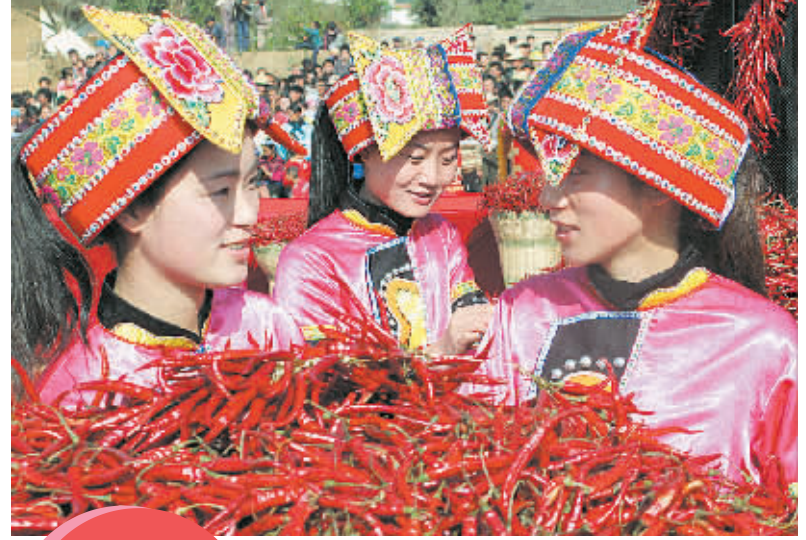
红火辣椒节 12月9日，在... 辣椒节现场气氛热烈，吸引了众多游客。