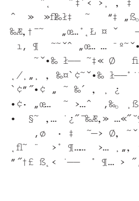
恐怖大亨拉丹与其儿子的合影首次公开，引发外界对其关系的猜测。

【新华社开罗15日电】恐怖大亨拉丹与其儿子的合影首次公开，引发外界对其关系的猜测。据称，这对父子在开罗的一家清真寺前合影，拉丹身穿传统头巾，而他的儿子则穿着现代服装。这一照片的公开引起了广泛的关注和讨论。