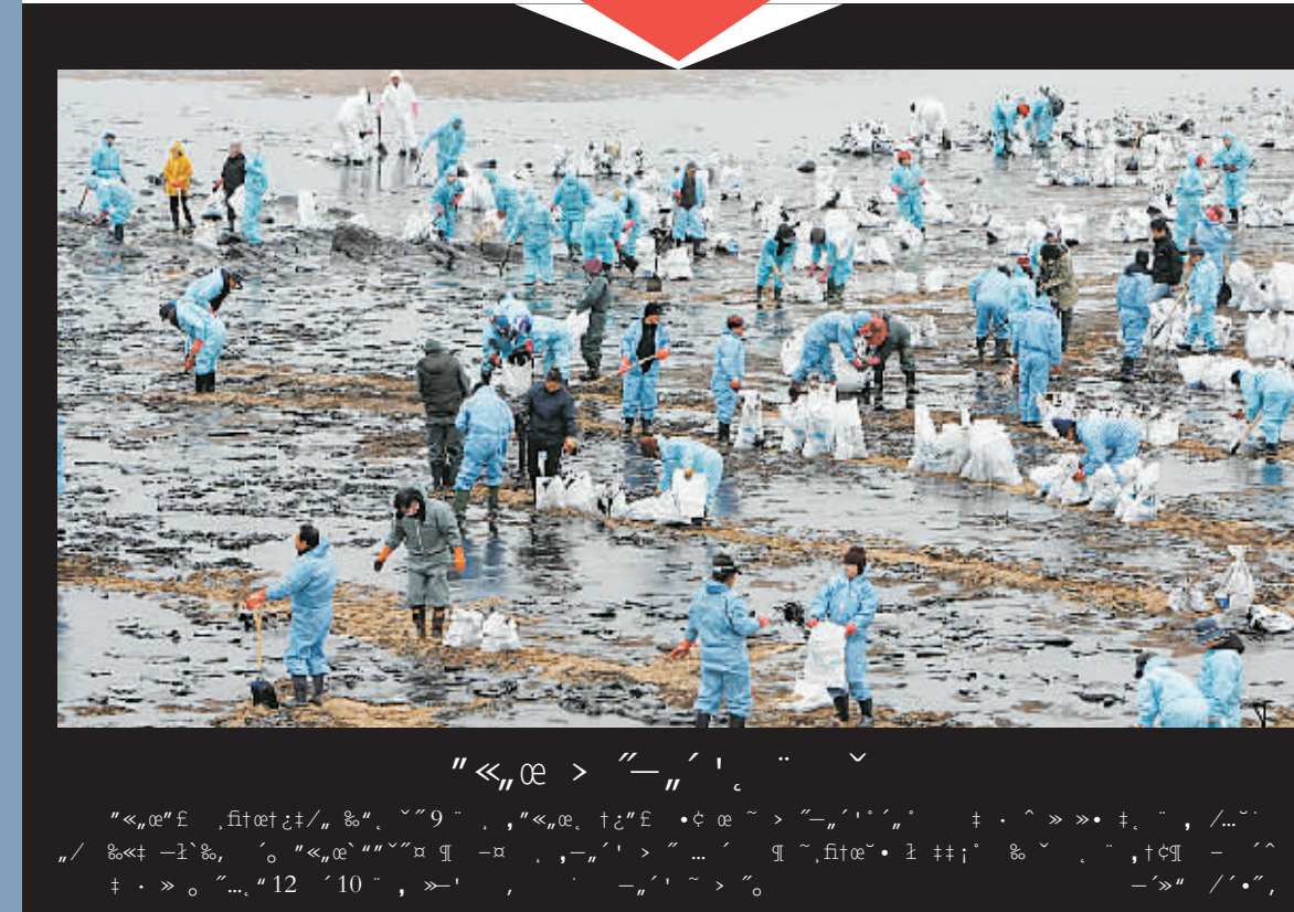
在波罗的海海滩进行清理工作，工作人员穿着蓝色防护服。