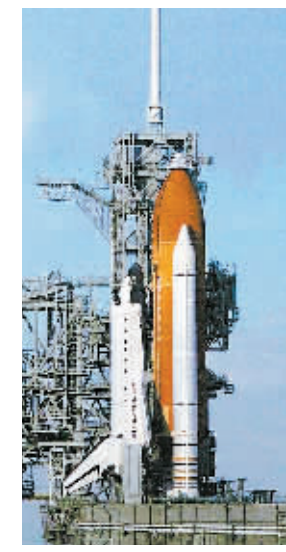
俄罗斯成功发射了一颗新的卫星，用于军事和民用通信。

【新华社莫斯科15日电】俄罗斯成功发射了一颗新的卫星，用于军事和民用通信。这颗卫星是俄罗斯“进步”系列卫星的一部分，旨在提高其通信能力和军事安全。发射过程顺利，卫星已按计划进入预定轨道。