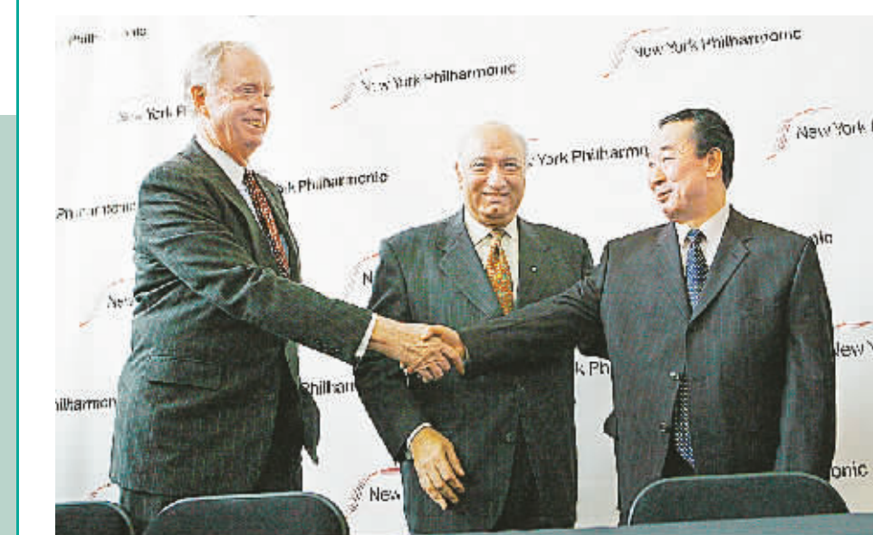
12月11日,朝鲜常驻联合国代表朴吉渊(右)和扎林·梅塔(中)出席在纽约林肯中心举行的新闻发布会。

纽约爱乐乐团团长扎林·梅塔11日在纽约的新闻发布会上宣布,应朝鲜文化部邀请,纽约爱乐乐团将于明年2月26日、27日赴平壤演出。曲目包括美国国歌、《一个美国人在巴黎》等。