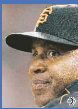
①前美国国会参议院多数党领袖乔治·米切尔在新闻发布会上。 ②③美国国家棒球联盟的“本垒打王”邦兹在比赛中的资料照片。