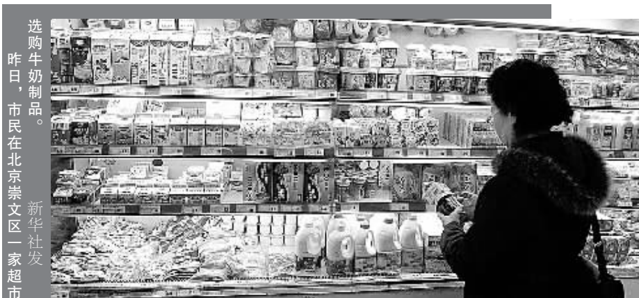
选购牛奶制品。昨日,市民在北京崇文区一家超市