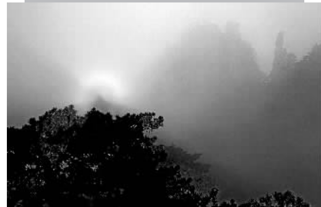
19日在黄山风景区拍摄的“佛光”奇观。当日,雨后转晴,安徽黄山清凉景区出现罕见的“佛光”奇观。