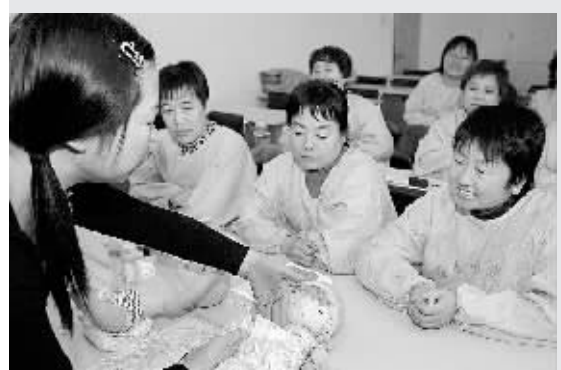
20日,石家庄市市长安区“青园爱心月嫂”培训中心老师在教月嫂包裹婴儿的正确方法。目前,石家庄市专业月嫂十分紧俏。