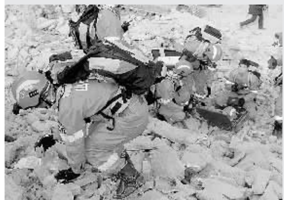
20日,地震紧急救援队员用生命探测仪器在“废墟”中搜寻“被困人员”。当日,山西省地震紧急救援队模拟临汾洪洞县一带发生6.5级地震,50多名救援队员奔赴现场,进行灾后救援演练。 新华社发