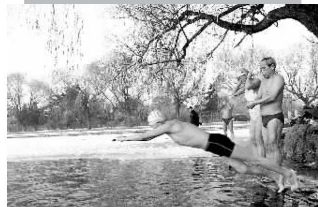
20日,几位冬泳爱好者在沈阳市北陵公园游泳。如今,越来越多的沈阳市民迷上冬泳运动,以强身健体。