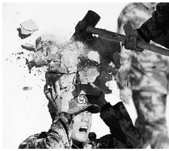
12月21日9时23分,“携手-2007”中印陆军联合反恐训练正式开始。这是中方参训部队士兵进行硬气功表演。

此外,记者了解到,近一段时间里,国外一些企业对ARJ21表现出了浓厚的兴趣,预计明年上半年有望再获一批海外订单。