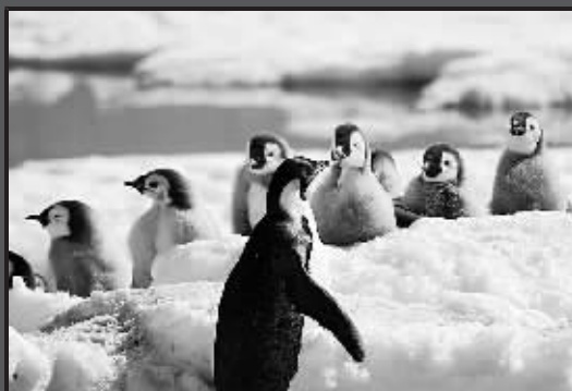
12月19日,南极企鹅岛上的“幼儿园阿姨”在“照看”一群小企鹅。这个企鹅岛位于我国南极中山站以北39公里处。