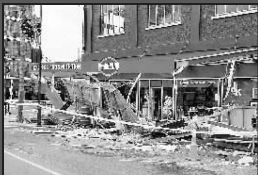
21日,新西兰北岛海岸城市吉斯伯恩的一家商店在地震中受到破坏。新西兰北岛东部海域20日晚发生6.8级地震,地震造成吉斯伯恩一些房屋轻微损坏,目前还没有人员伤亡的报道。

梅德韦杰夫20日在俄中央选举委员会接受媒体采访时说,如果当选总统,“我不会感到害怕,但我会感到紧张,因为我需要证明没有辜负那么多民众对我的信任,他们希望我为国家承担起一项艰巨的工作”。