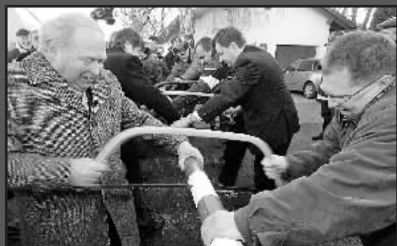
20日,在捷克与德国的交界处,两国一些城市的政要共同锯断一根象征两国边界的拦道木。从本月21日开始,爱沙尼亚、匈牙利、立陶宛、拉脱维亚、马耳他、波兰、斯洛文尼亚、斯洛伐克和捷克9个欧盟成员国加入《申根协定》。这使申根国家由15个扩大到24个。