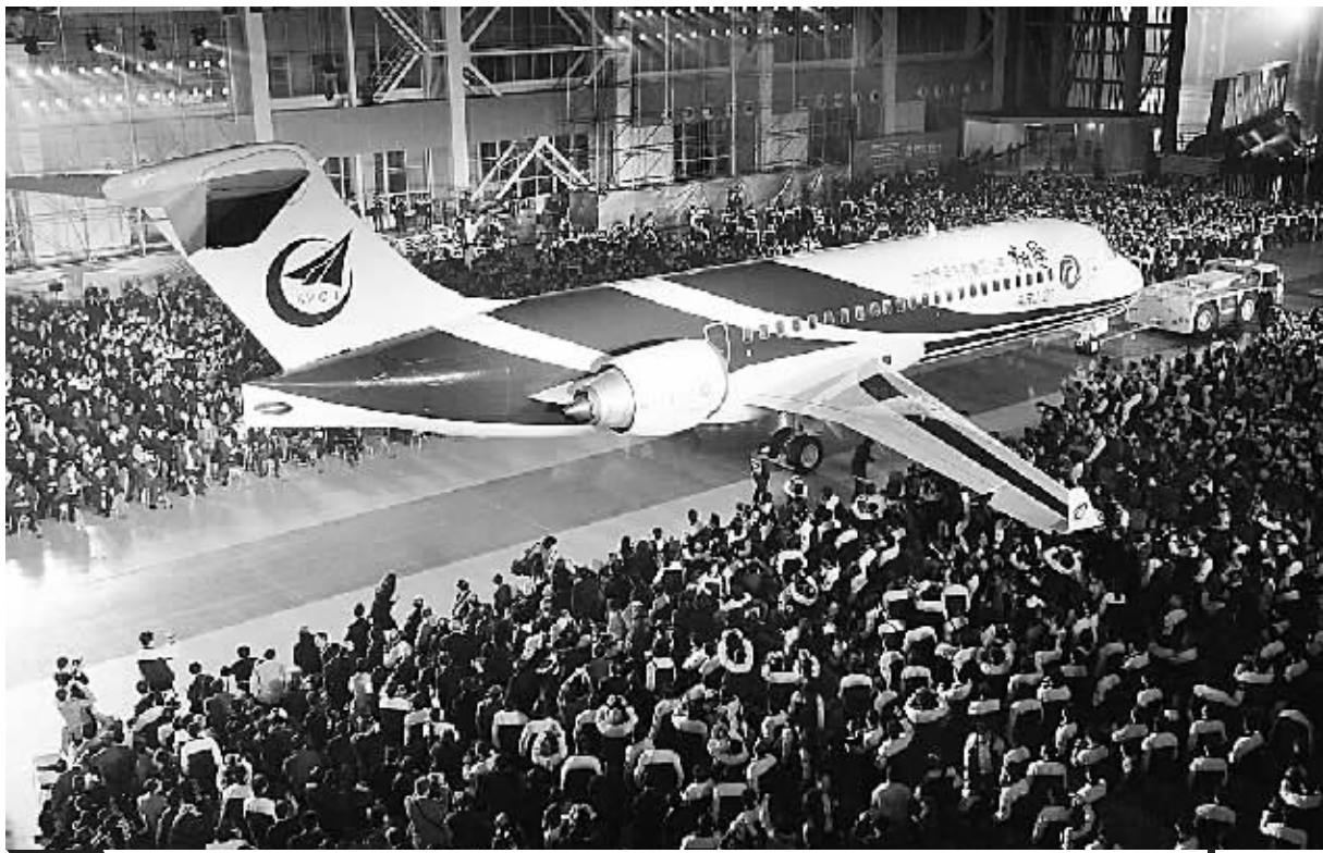
12月21日,我国首架具有自主知识产权的新支线飞机ARJ21-700在上海飞机制造厂总装下线。这标志着中国重大自主创新工程ARJ21飞机的研制工作全面完成,中国飞机正式跻身世界民用客机行列。

据专家介绍,“翔凤”基本型为单通道机舱,每排5座,一侧为三排座,另一侧为两排座,是当今支线飞机中客舱最宽敞的飞机之一。同时,人均0.06至0.07平方米的行李仓位,相当于150座干线飞机标准,可以避免乘坐一般小型支线飞机行李无处放的尴尬。据了解,“翔凤”还具有特别适应我国西部地区高原、高温和航路复杂飞行条件的环境适应优势和超临界机翼速度快、发动机油耗低等运营经济优势。