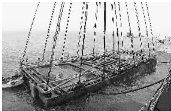
21日,“南海一号”古沉船被打捞出水。在海底沉睡多年的“南海一号”为南宋时期商船,沉没于广东省阳江市东平港以南约20海里处,是迄今为止世界上发现的海上沉船中年代最早、船体最大、保存最完整的远洋贸易商船,船舱内保存文物总数估计为6万至8万件。