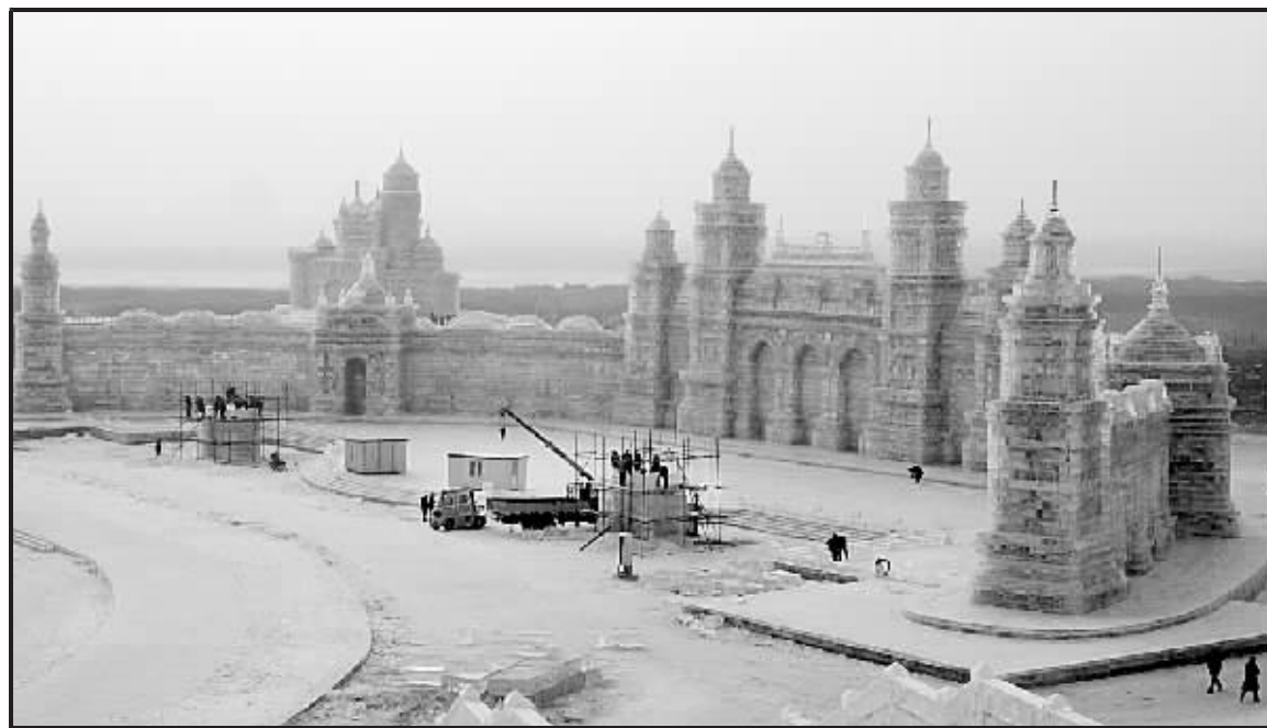
12月24日,工人正在建造冰景。12月23日已试开园的第九届哈尔滨冰雪大世界的冰景建设已进入收尾阶段,按计划下月初将正式开园。

新华社北京12月24日电 据台湾媒体报道,在陈水扁扁月初明年元旦后合军方将不再派员驻守位于桃园大溪的蒋介石、蒋经国父子临时墓地后,“两蒋”墓园于24日正式暂停对外开放。合军方派驻的管理机构已于23日晚完成撤哨,驻守于此已32年的卫队随后撤离。 蒋介石、蒋经国去世后,并未入土为安,而是将灵柩分别暂厝于桃园县的慈湖、头寮两地。