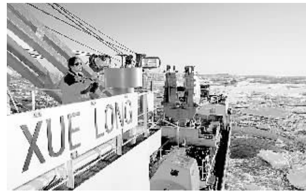
12月23日,中国第24次南极科考队员在“雪龙”号上拍摄浮冰区。当日,在圆满完成中山站的卸货任务后,“雪龙”号极地科学考察船离开位于东南极的中山站,前往西南极的长城站,执行科学考察和运输补给任务。

查,确保各项资金合理、有效使用。四是充分发挥审计监督的建设性作用。审计工作要坚持把查处问题与促进改革、完善制度、强化管理结合起来。对于审计发现的典型案件,不仅要审深审透,严肃处理,还要深入分析,找出问题的原因和症结,从完善制度、机制上有针对性地提出审计意见和建议。 温家宝强调,人民信任审计机关,把重任交给审计机关,党和政府也对审计工作寄予厚望。审计机关要进一步加快管理创新,加强自身建设,努力培养造就一支政治过硬、业务精湛、清正廉洁的审计队伍,规范审计行为,确保审计质量,切实提高审计的公信力和执行力。