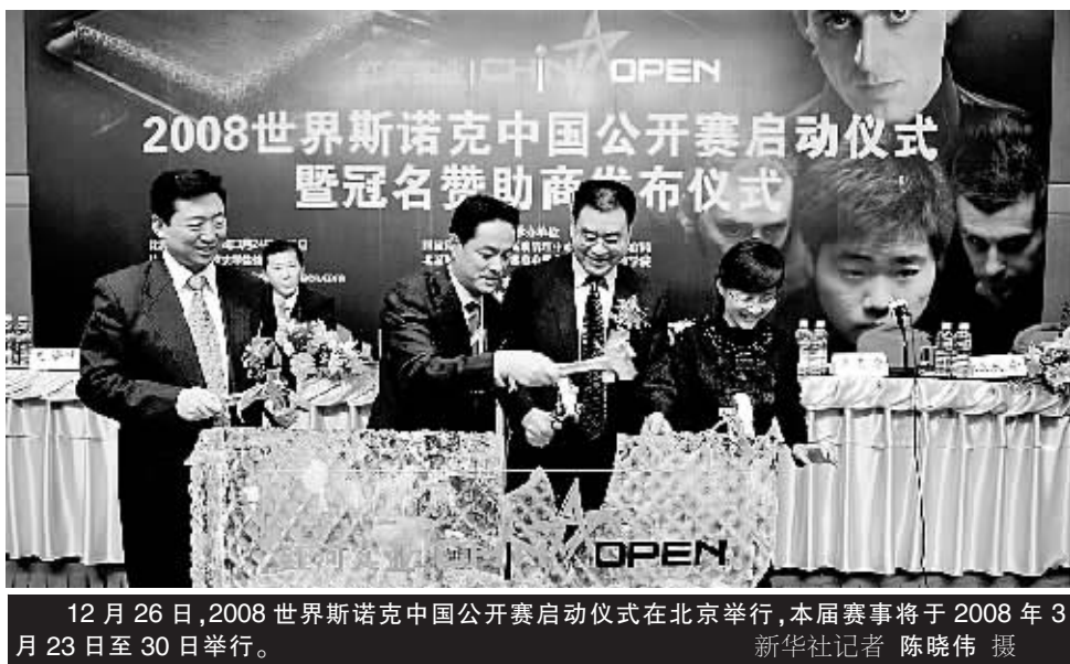
12月26日,2008世界斯诺克中国公开赛启动仪式在北京举行,本届赛事将于2008年3月23日至30日举行。

詹姆斯、韦德、奥尼尔、科比、杜兰特,今年的“圣诞大战”群星闪耀。随着奥尼尔的“星光”不断“暗淡”,年轻的球员们为球迷们诠释了新生力量的威力。没有“OK”之间的恩怨之战,“新口味”的“圣诞大战”也很OK。 本报记者 陈凯