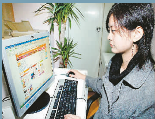
12月26日,来自中国电信上海公司的最新数据显示,上海的宽带用户已达300万,成为全国宽带用户数量最多的城市。图为一名上海市民在浏览网页。