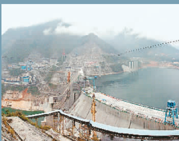
12月26日,龙滩水电工程首批3台机组正式发电。龙滩水电站是我国西部大开发标志性工程,总投资300多亿元,规划总装机容量630万千瓦。图为龙滩水电工程大坝。