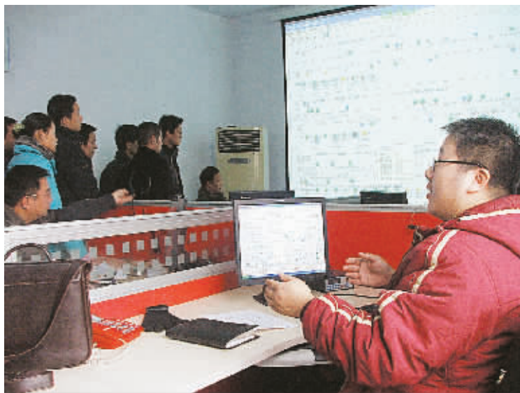
26 日, 郑州公交六公司 GPS 智能调度系统正式启用。据悉, 该系统使用后, 在 GPS 调度室的电脑显示器上, 能清楚看到每辆车在线路上的运营情况, 调度可根据实际需要, 随时对车辆运营间隔进行调整, 最大限度缩短乘客候车时间。

记者就此事采访了民政部门, 郑州市社会事务处有关负责人告诉记者, 市民个人在报纸上登征婚启事, 只要能出具民政局开的单身证明就可以, 他们既不反对也不支持。