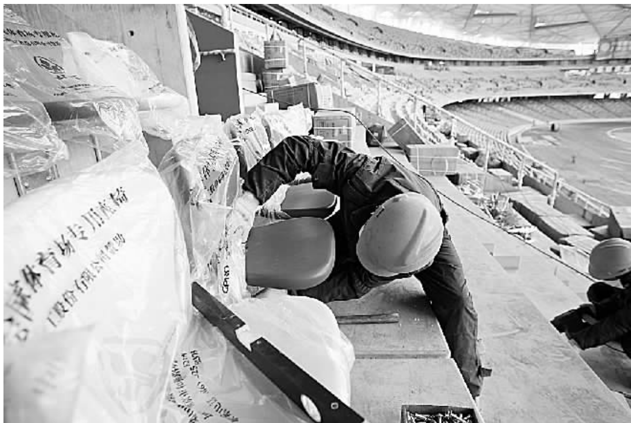
1月2日,工人在国家体育场内安装座椅。国家体育场日前开始安装座椅,预计春节前后完工。国家体育场(“鸟巢”)于2003年12月24日开工建设,预计2008年3月竣工。

在3月12日和19日将有两场亚冠比赛,为了国脚不受旅途奔波的劳累,足协还计划让参加亚冠比赛的两支俱乐部的国脚只归队参加主场比赛,不参加客场比赛。这个设想将在与俱乐部沟通后做最后决定。