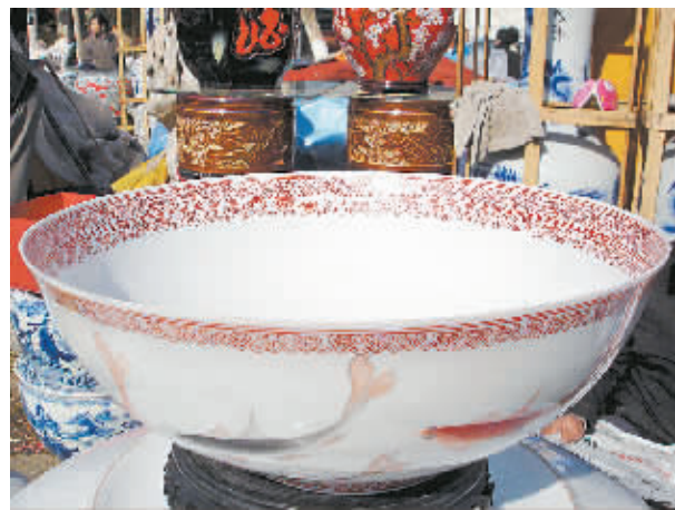
1月2日,在苏州举办的景德镇精品瓷器展销会上拍摄的薄胎瓷碗。这只薄胎瓷碗重748克、直径60厘米、碗底厚度仅0.275厘米。