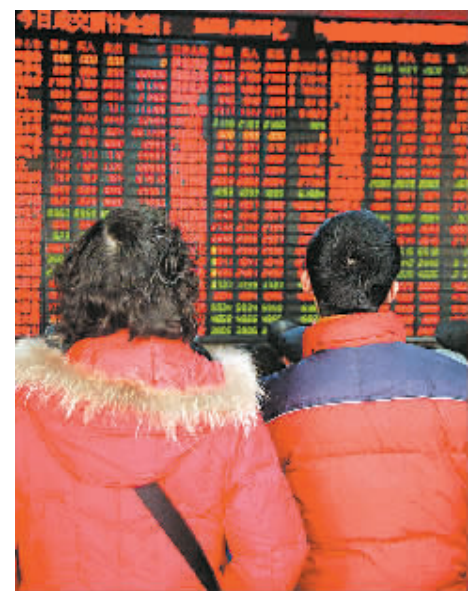
承接新年首个交易日的上升势头,1月3日,沪深股市放量走高,上证综指重登5300点关口,以5319.86点报收。