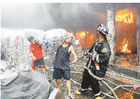
菲律宾一购物中心失火 1月3日早晨5点,在菲律宾大马尼拉区帕赛市购物中心发生火灾,大火造成沿线地铁暂时停运,目前尚无人员伤亡报告。