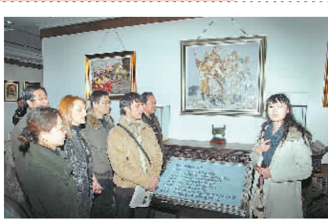
俄罗斯油画画家戈比·布莱耶夫的个人作品展昨日在郑州艺园画廊开展。戈比·布莱耶夫曾于2006年作为特聘教师在中国戏曲学院任教,此次展出的都是他在华任教期间创作的作品。画展将于1月12日结束。

日前有消息称,2008春晚将挤出时间给奥运节目,由于语言类节目并没有奥运题材,奥运节目将会在歌舞类节目时段出现。春晚剧组的宣传负责人在接受采访时虽没有否认这一说法,但他表示:“奥运应该是2008春晚一个很重要的内容,具体怎么搞还在研究。除了奥运,中国男足开始冲击2010年世界杯,小组赛第一场是在2月6日除夕之夜客场迎战伊拉克,春晚是否也要有为国脚加油的环节,我们也在考虑。” 春晚总导演陈临春也表示:“很多奥运代表队,像女排、男足等都在备战,可能春节都不会在国内,请他们到春晚现场有很大难度,所以说2008春晚如何与奥运结合现在还没有定论。” 解宏乾