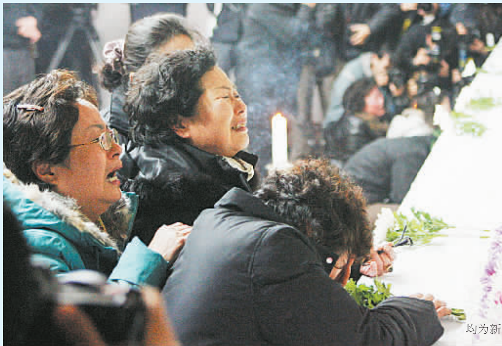
爆炸事故遇难者的家属参加集体悼念活动。