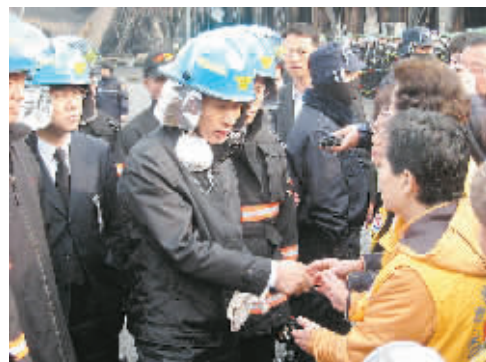
韩国当选总统李明博视察利川爆炸现场。