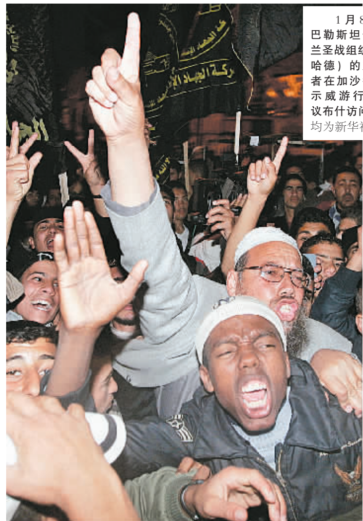
1月8日,巴勒斯坦伊斯兰圣战组织(杰哈德)的支持者在加沙举行示威游行,抗议布什访问。

不过,对于布什的这次中东之行,人们并不抱太大的希望,也几乎没有人相信布什能够在巴以问题上取得突破。