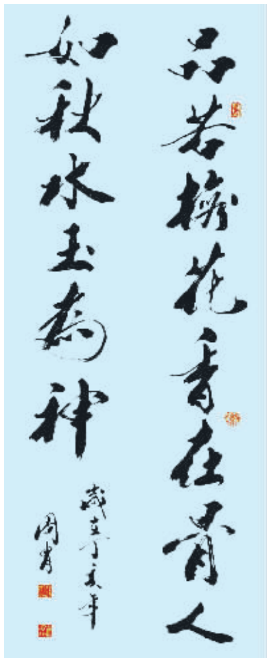
品若梅花香在骨 人如秋水玉为神(书法)