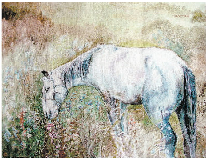
草原白马(水粉画) 高复兴

1929年8月9日，美联储将利息提高到6%，紧接着美联储纽约银行将证券交易商的利率由5%提高到20%。