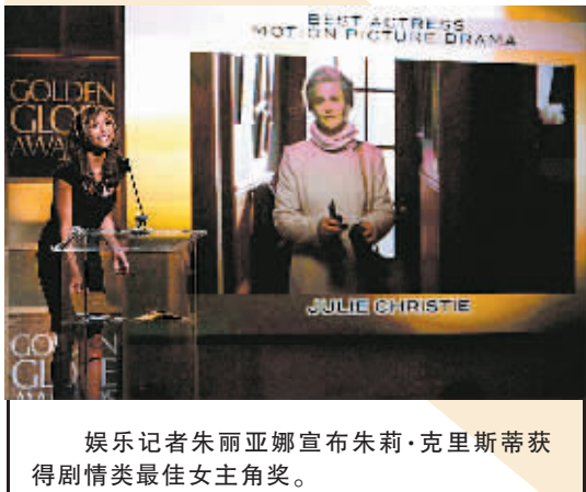
娱乐记者朱丽安娜宣布朱莉·克里斯蒂获得剧情类最佳女主角奖。