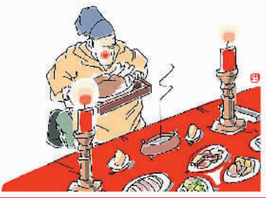
腊八——猎兽祭祖