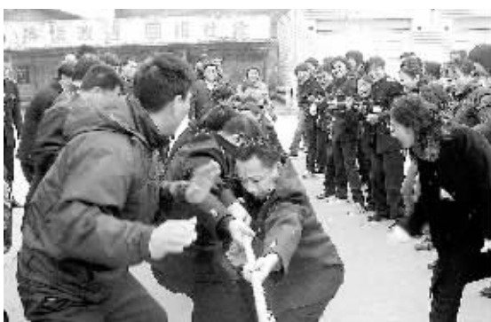
昨日,上街区地方税务局举行了第一届“财税杯”健身运动会,全体员工参加了拔河、跳绳、跳棋等比赛,这种欢快健身的方式,营造了和谐团结氛围。

本报讯(记者 梁月琳 通讯员 胡昕 汤景华)昨天上午,二里岗街道司法所对辖区专职人民调解员进行岗前业务知识专项培训。 培训主要包括《人民调解协议书》书写规范、《物权法》解读、婚姻家庭矛盾调处的法律适用及技巧方法等。人民法院法官就“人民调解协议”的法律效力进行讲解,同时针对婚姻、家庭纠纷在《婚姻法》、《民法通则》等法律中的法律适用进行了详细的分析和解释;法律工作者则就《物权法》实施后可能遇到的物业纠纷进行了预测性分析。 据了解,今后我市各社区将陆续配备至少3名专职人民调解员,其主要工作就是化解邻里间、家庭中的各类矛盾,维护基层社会稳定。