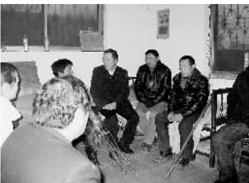
近日,惠济区审计局根据老陈陈街道办事处师家河村提供的特困户证明材料,走访看望5户贫困农民,并向特困户捐款1500元。

目前,朝阳社区已有三栋居民楼被分别命名为文化楼、关爱楼和先锋楼。这些特色楼创建给邻里关系带来的巨大变化,改变了过去邻里之间冷漠关系,居民经过交流沟通,增进了理解和友谊,邻里关系变得更亲近了。