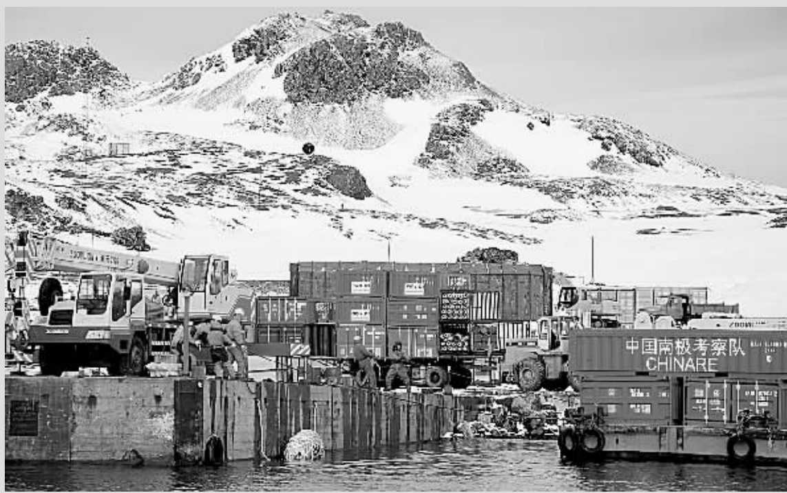
1月15日,我国第24次南极科学考察队员在南极长城站码头卸货。我国第24次南极科学考察队员经过10天的昼夜奋战,于1月15日将“雪龙”号极地科学考察船上1500吨的各类物资和油料,全部卸运到我国南极长城站,圆满完成了第一阶段的卸货任务。