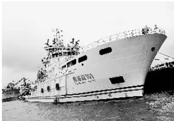
15日,被称为“中国海上第一救”的中国最大型海洋救助船“南海救101”轮首次驶抵上海外高桥码头。据了解,“南海救101”轮在上海停留补给后,将前往渤海湾水域执行冬季海上救助任务。

收费标准为,未超限车辆基本费率为0.07元/吨公里。车货总质量小于等于5吨,按基本费率计收;车货总质量大于5吨小于等于35吨,按基本费率线性递减至0.04元/吨公里计收;车货总质量大于35吨小于等于49吨,继续递减至0.0286元/吨公里计收。