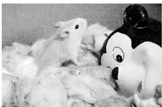
这是花鸟市场上的一只“迷你”宠物鼠(1月16日摄)。鼠年来临之际,南宁花鸟市场上可爱的“迷你”宠物鼠受到了人们的欢迎。